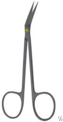
DELICATE, ANGLED FEIN, GEWINKELT 115 mm