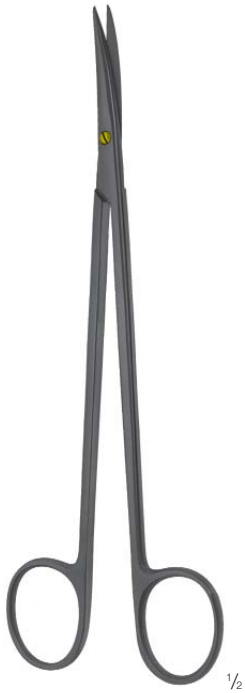
METZENBAUM FINO 1/2