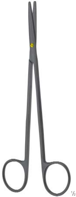
METZENBAUM FINO 1/2