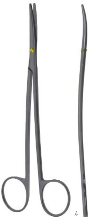
METZENBAUM FINO 1/2