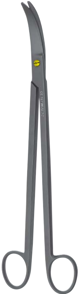
CREAMO ® PARAMETRIUM