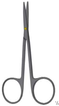
Delicate dissecting scissors Feine Präparierschere