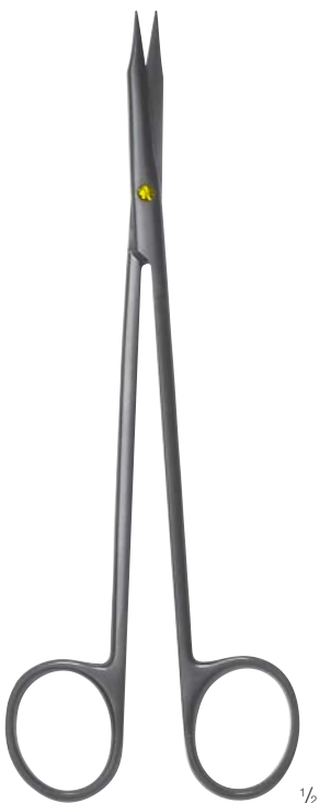
CERAMO® TC STEVENS/REYNOLDS