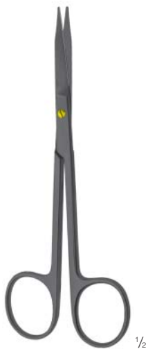
CERAMO® TC GOLDMANN-FOX