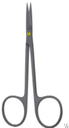
Delicate dissecting scissors Feine Präparierschere