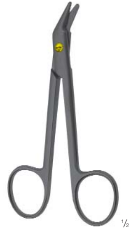
UNIVERSAL 120 mm